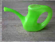
arrosoir 0,9 litre